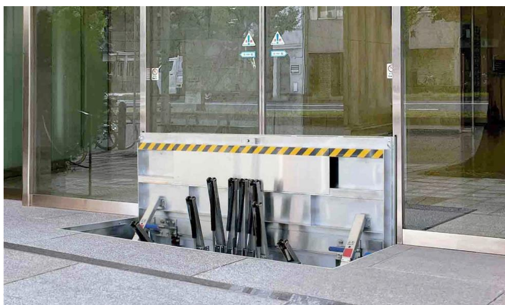
写真：開口幅 W：2000mm、対応水位 H：600mm

株式会社鈴木シャッター（本社：東京都豊島区／社長：濱野壽之）は、アピアガードシリーズ「起伏タイプ防水板（手動跳ね上げ式）」を10月12日より発売します。