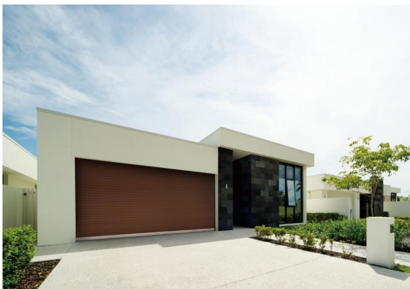
「エレガノ STワイド (スチールスラット・ワイドタイプ) [スラット色: トートチェリー]