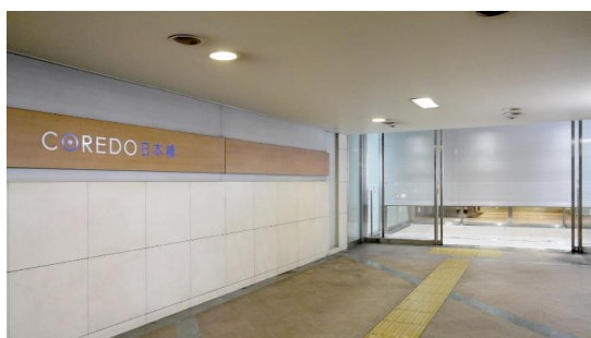
防水シャッター 施工写真 (コレド日本橋／日本橋一丁目三井ビルディング)