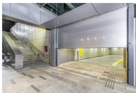
防水シャッター 施工写真 (三井住友銀行本店ビルディング)

2014年10月より、水害時に建物内部への浸水を防ぐ防水商品として防水シャッターをはじめ、色々な用途に合わせた防水商品を発売してきました。この度、「ウォーターガード 防水シャッター」を商業施設「コレド日本橋／日本橋一丁目三井ビルディング」および「三井住友銀行本店ビルディング」とそれぞれ地下鉄を結ぶ連絡通路に地下鉄からの防水対策を目的に事業主である三井不動産に採用いただき、2016年3月に施工しました。