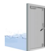
ウォーターガード Wタイトドア