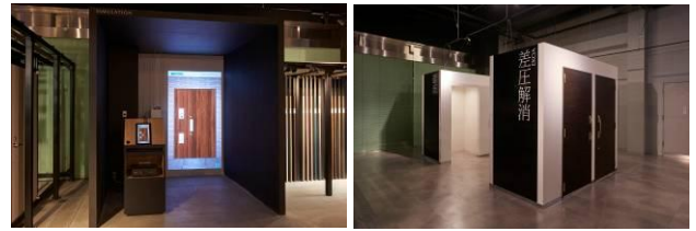
ドア シミュレーションコーナー

ショールーム内には簡単な打ち合せができるスペースや個別のご相談・ご商談ができるパーティションで間仕切りされたスペース、そして約18名が入れるプレゼンテーションルームがあります。お客様とのご商談や情報交換から抽出された問題点や課題等をスピーディーに商品開発に反映させるビジネスコミュニケーションの場としても活用していきます。