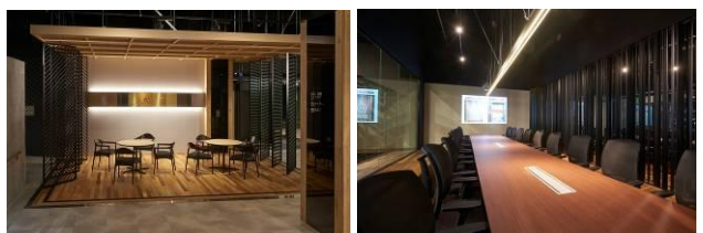
ミーティングスペース