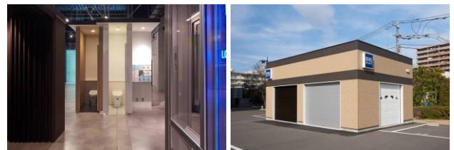
トイレブースコーナー