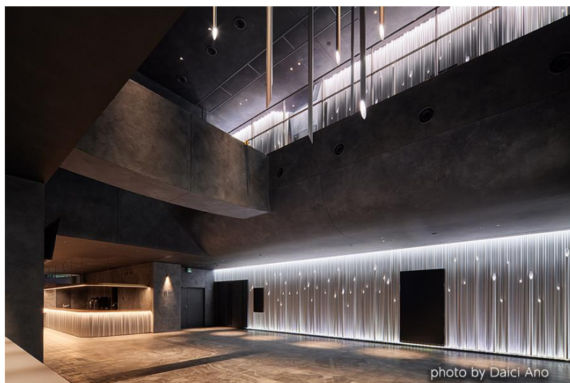
第54回(前回) グランプリ 「東急歌舞伎町タワー-THEATER MILANO-Za パイプアート」

1970年より開催し業界最長を誇るストアフロントコンクールでは、昭和フロントのアルミ建材を使用した施工例の中から優秀な作品を表彰し、発表することで、新たなストアフロントの可能性を示す役割を担ってまいりました。