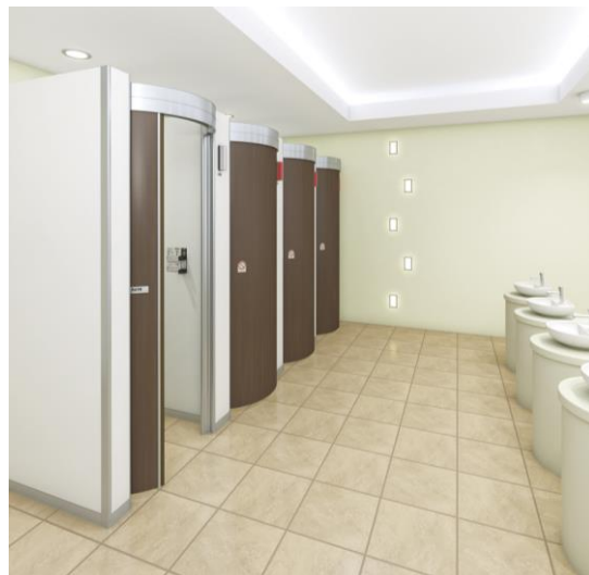
※2021年1月現在当社調べ

三和シャッター工業はお客様の多様なニーズにお応えできるよう、安全・安心・快適を提供することにより社会に貢献するという使命のもとに、お客様の視点に立った商品を今後も提供してまいります。