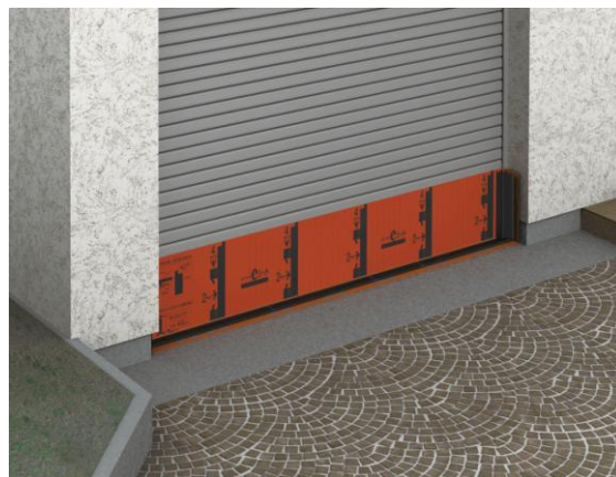
「ウォーターガード eシート」

近年、記録的な台風や局地的な集中豪雨による水害が増加しております。これまでは河川の氾濫（外水氾濫）が問題となり対策が進められてきましたが、現在は都市型水害として都市部における地下空間や住宅地などで排水が追いつかず浸水する被害（内水氾濫）が問題となっております。集中豪雨は予測が難しく短時間で浸水被害が発生するため、危険を察知した際の迅速な対応が求められております。