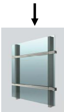
バックマリオンタイプ 閉鎖時外観イメージ