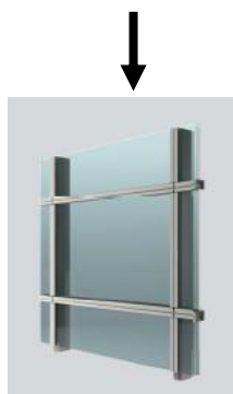
マリオンタイプ 閉鎖時外観イメージ