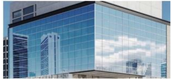
バックマリオンタイプ