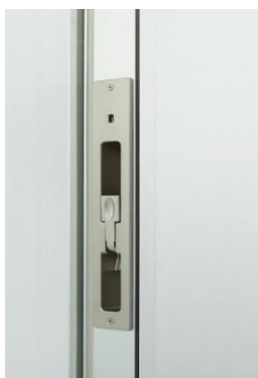
フラットハンドル (内部用ハンドル)

従来のたてすべり出し窓は、ハンドルや調整器等の部品が露出していました。ローライズXではかまち収納タイプのフラットハンドルや開放制限アームの使用によりFIXと統一した意匠を可能にしました。