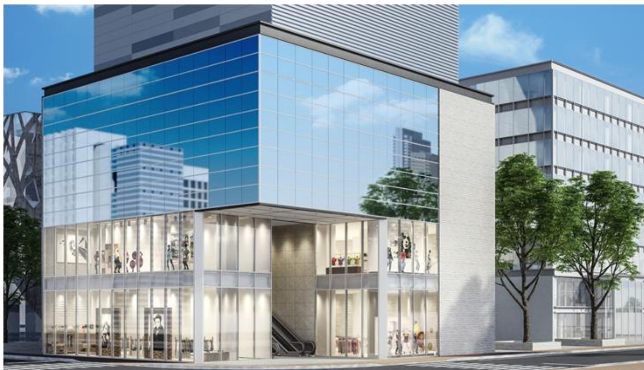
「ローライズX」取付イメージ

昭和フロントでは、これからもお客様と社会のニーズに合わせた商品作りを行っていきます。