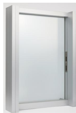
閉鎖時内観イメージ