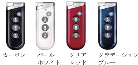
カーボン パールホワイト クリアレッド グラデーションブルー