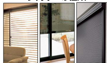
ブラインドタイプ