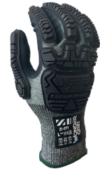
耐切創・耐衝撃手袋

これからも三和グループはさらなる挑戦を続け、持続可能な社会の実現に向けて未来への歩みを加速してまいります。